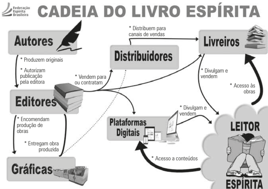
Figura 2: Cadeia do Livro Espírita

comum. É um negócio de administração” (KARDEC, Allan. Obras póstumas . Constituição do Espiritismo, 2ª pt., it. IX – Vias e meios).